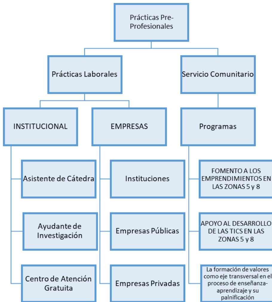
Ilustración 3, Estructura de Prácticas Pre-Profesionales

Es requisito para la obtención del título que los estudiantes cumplan con las prácticas preprofesionales que se estructuran a modo de proyectos a ser desarrollados en el ámbito institucional, empresarial o en el ámbito comunitario.